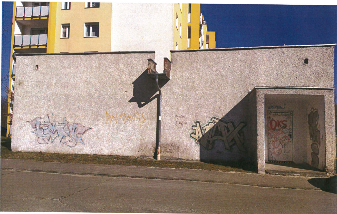
Ściana czołowa z wejściem

Zadanie obejmuje cztery ściany budynku – zgodnie z poniższymi grafikami: