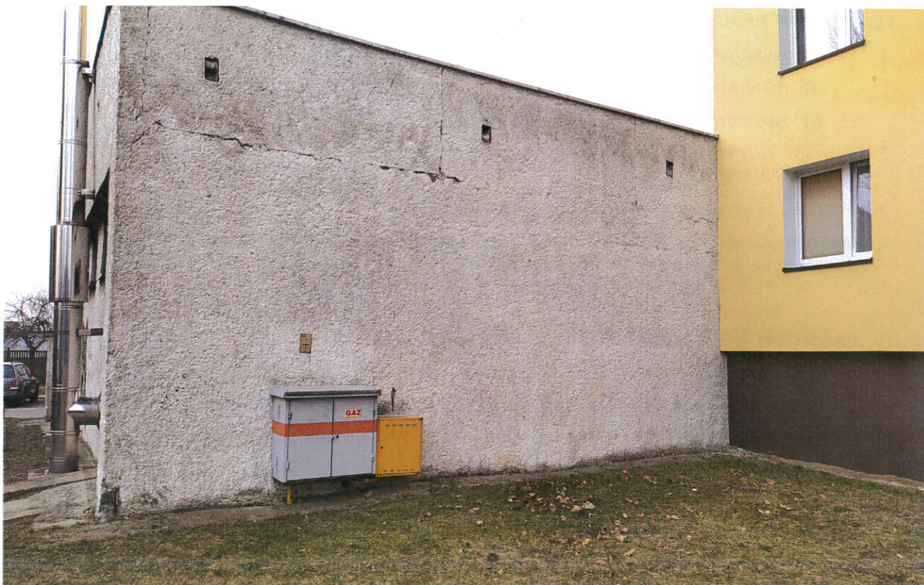
ściana z tyłu budynku

Zadanie składa się z następujących prac do wykonania: